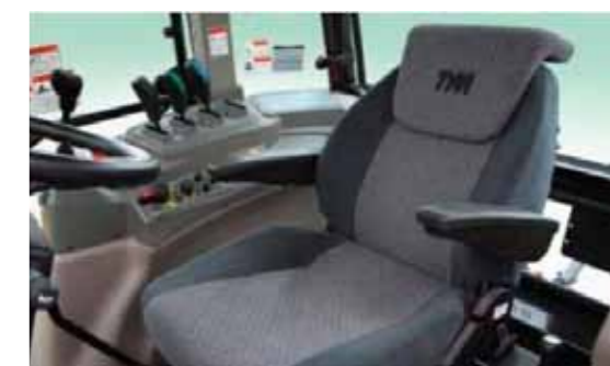
T1204 • T1304