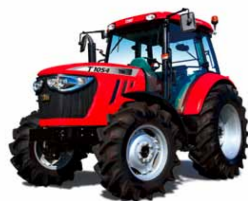
T854 • T954 • T1054