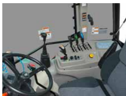
T854 • T954 • T1054