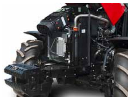
T854 • T954 • T1054