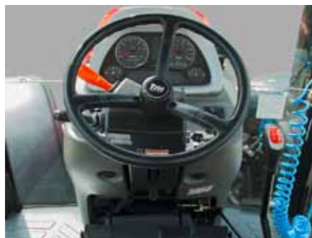
T854 • T954 • T1054