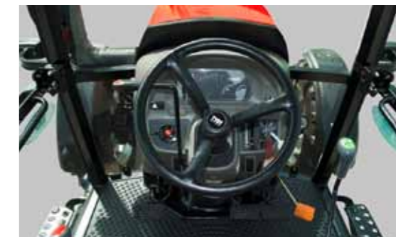
T654 • T754