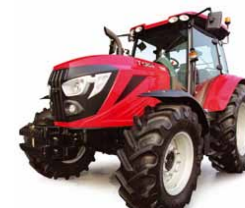
T1204 • T1304