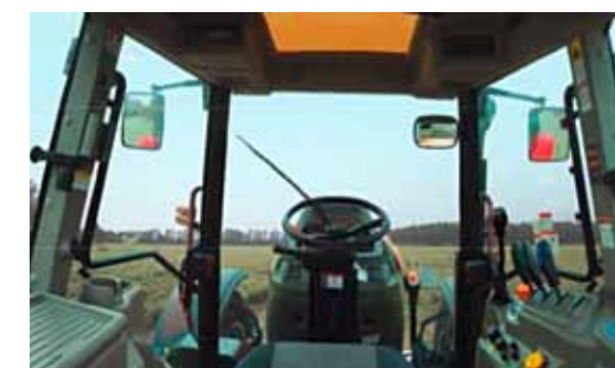
T1204 • T1304